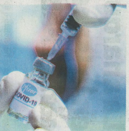
Pfizer liberó patentes recientemente.