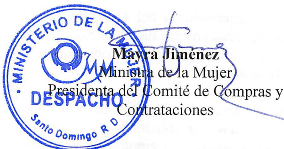
Mayra Jiménez Ministra de la Mujer Presidenta del Comité de Compras y Contrataciones

Dada en la ciudad de Santo Domingo de Guzmán, Distrito Nacional, capital de la República Dominicana, a los Cinco (5) días del Mes de Marzo del Año Dos Mil Veintiuno (2021).