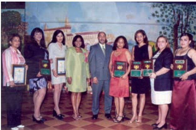
Reconocimiento a mujeres cooperativistas.

—Desde el nacimiento mismo de la cooperativa se formó un comité de mujeres. Nuestros fundadores fueron visionarios e instituyeron ese comité. Las mujeres fueron construyendo su propio espacio, incluido un congreso, para socializar sus problemáticas, y demandaron un programa de actividades formativas que las dotara de los conocimientos y herramientas para sustentarse económicamente.