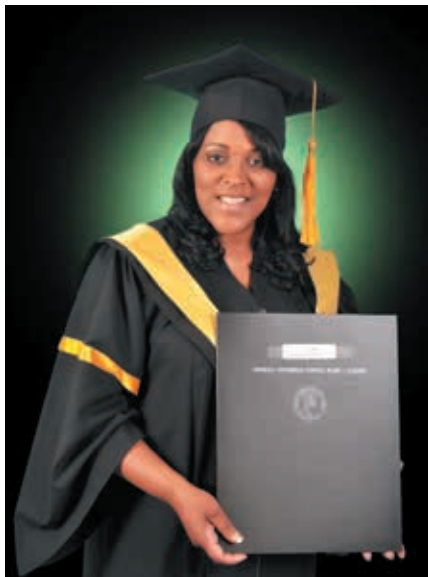
Graduación de su maestría en Gestión Estratégica en la PUCMM.

—Fue entonces cuando inicié la licenciatura en Administración de Empresa. La experiencia me había demostrado que, para continuar avanzando, necesitaba un título. De hecho, en cada ocasión en que fui responsabilizada de un departamento, me preparé antes y durante. Cuando ocupé el Departamento de Recursos Humanos, realicé varios diplomados para entender mejor el funcionamiento de un área tan neurálgica como esa. Asimismo, años después, para ocupar la Gerencia General cursé una maestría en Alta Gerencia, concentración Estrategia, en la Pontificia Universidad Católica Madre y Maestra. Pero no solo yo me he ocupado de mejorar y actualizar mi nivel académico; en la empresa, todos los gerentes han tenido, y tienen, la misma oportunidad. Hemos crecido con la empresa, integralmente.