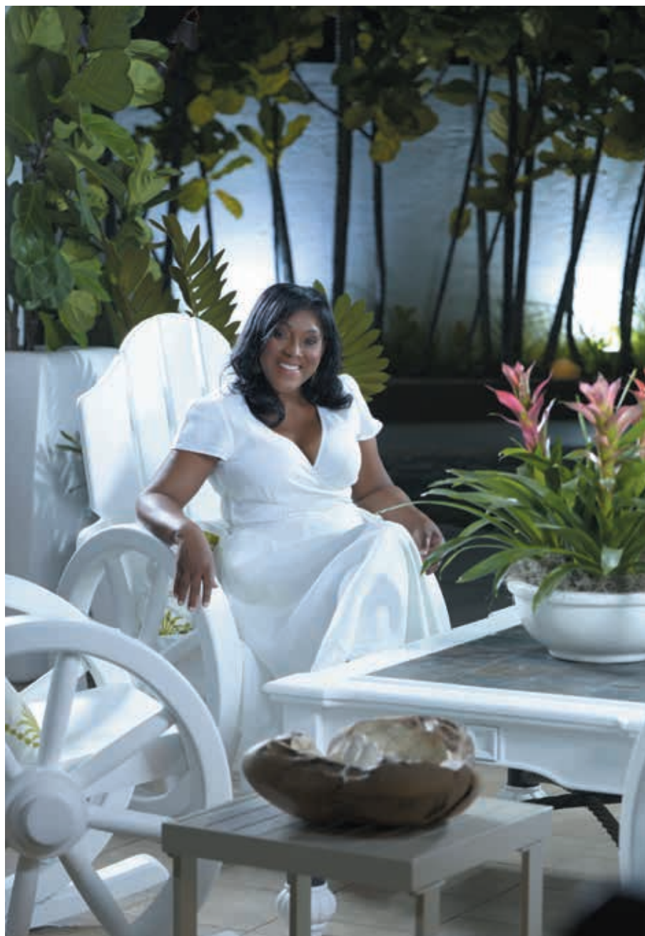
Apreciando la belleza de la naturaleza.