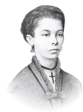
Salomé Ureña (Santo Domingo, 1850-1897)