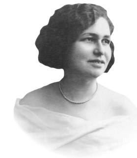
Abigaíl Mejía (Santo Domingo, 1895-1941)

"Estación en la tierra", "Una mujer está sola" y "La casa" confirman la soledad y la rebeldía que caracteriza la mayor parte de sus textos y fortalecen, al mismo tiempo, el sentido social de una producción literaria que en su conjunto aboga por situar a la mujer de su época en su justo espacio y dimensión. Su novela Escalera para Electra fue finalista del Premio Biblioteca Breve de la editorial Seix Barral en 1969.