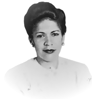
Aida Cartagena Portalatín (Moca, 1917 – 1994)

En 1937, comenzó a escribir cuentos que fueron publicados en diferentes diarios, especialmente en la Información, de Santiago. Publicó dos volúmenes de cuentos: 4 Cuentos (1953) n.º 3 de la Colección La Isla Necesaria y El Ojo de Dios, Cuentos de la Clandestinidad (1962) Colección Baluarte, Ediciones Brigadas Dominicanas, y uno de ensayo: Doña Endrina de Calatayud (1952). Además, La Tierra esta Bramando (1986), novela corta. Tiene inéditas: "Pueblo Chiquito" (Ficción y realidad), "La Carnada" (cuentos de relatos de ayer) y "De Aquí y de Allá", apuntes. Entre dos Silencios (1987), y Facetas de la Vida (1993) hecha por la autora del material que atesora sin ser recogido en libro, salvo, La Ventana, que apareció en 4 Cuentos.